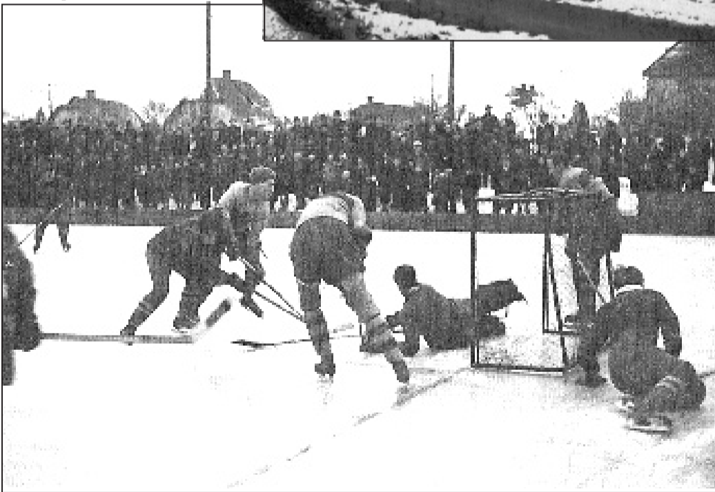
Z mezinárodního zápasu Zbraslav : Belgie v roce 1947

oddíl kanadského hokeje. Po první světové válce se stává velice úspěšným klubem, o čemž svědčí titul Mistra českého venkova z roku 1928 nebo start zbraslavského odchovance Bohumila