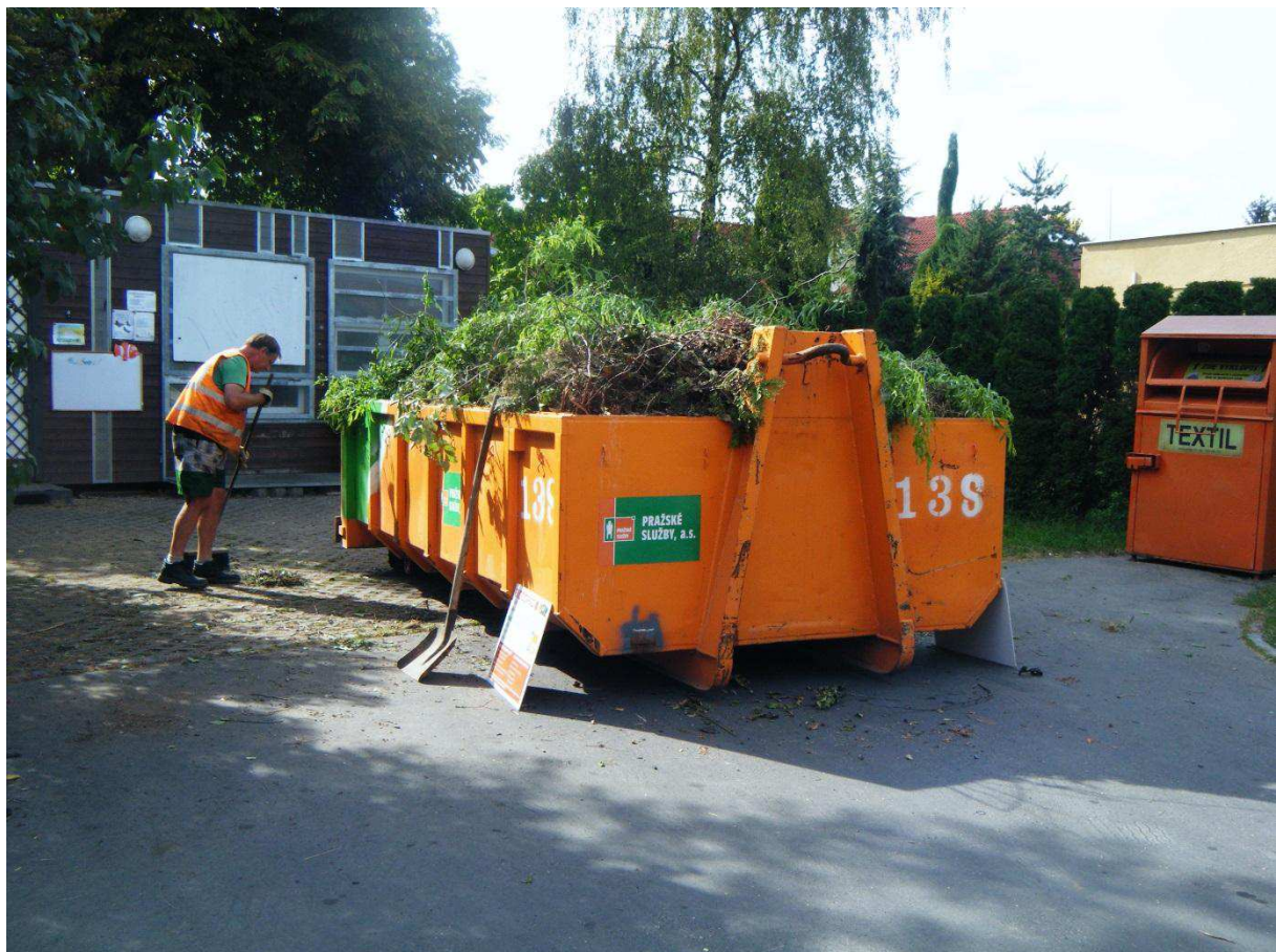
Hình số 5: Công tây nơ thu đồ thải tự nhiên ở Praha – Dubč

Thời điểm và địa điểm đặt các công tây nơ có thể tìm trên trang môi trường www.daa.nu đã nêu hay trên các thông báo của Ủy Ban các quận từ Praha 1 đến 57.