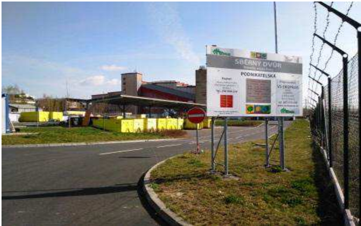
Hình số 4: Bãi thu đồ thải ở đường Zakrytá thuộc địa phận Ủy Ban Praha 4